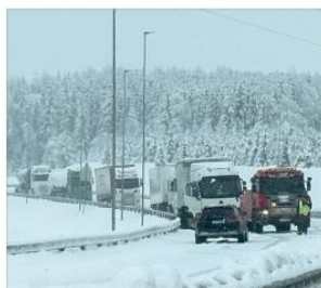
SPERRER: Politiet er på stedet for å bistå.