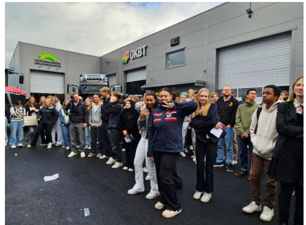
Hele 280 ungdommer deltok på Gjøvik.