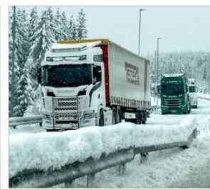
TROBBEL: Vogntogene sto fast på rad og rekke oppover riksvei 4 mellom Gjøvik og Raufoss.