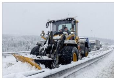
SNØRYDDING: Politiet og snøryddemaskiner er på plass.