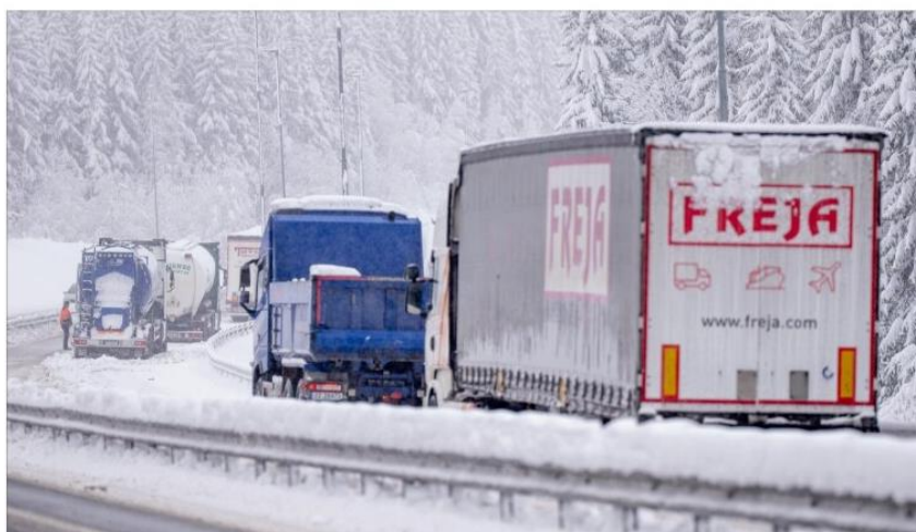
TROBBEL: Minst ti vogntog fikk trøbbel opp riksvei 4 mellom Gjøvik og Raufoss.