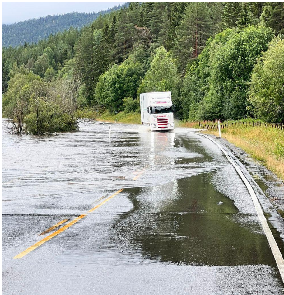
«Hans» herjet i Innlandet. Her fra rv.3 Stor-Elvdal.